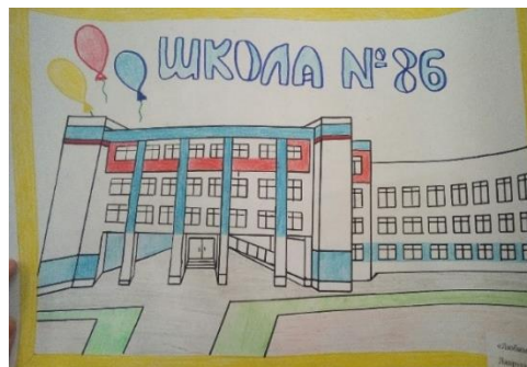
«Родная школа» Лаврусь Валерия